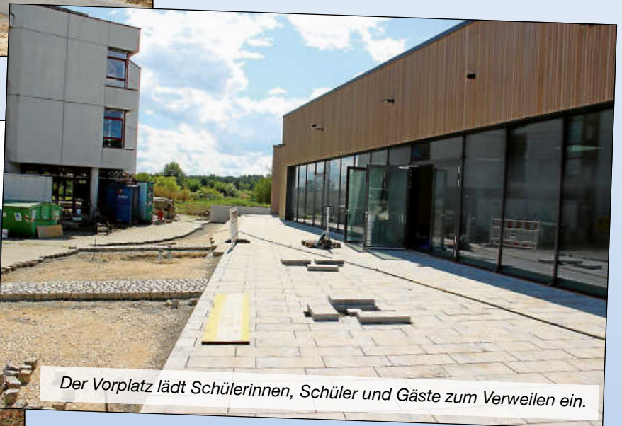
Der Vorplatz lädt Schülerinnen, Schüler und Gäste zum Verweilen ein.