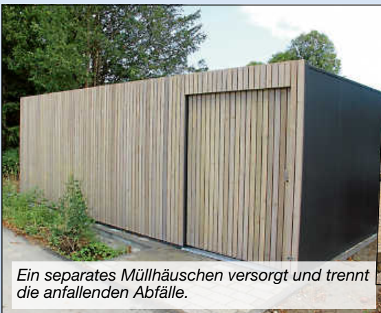
Ein separates Müllhäuschen versorgt und trennt die anfallenden Abfälle.