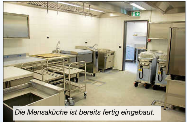
Die Mensaküche ist bereits fertig eingebaut.