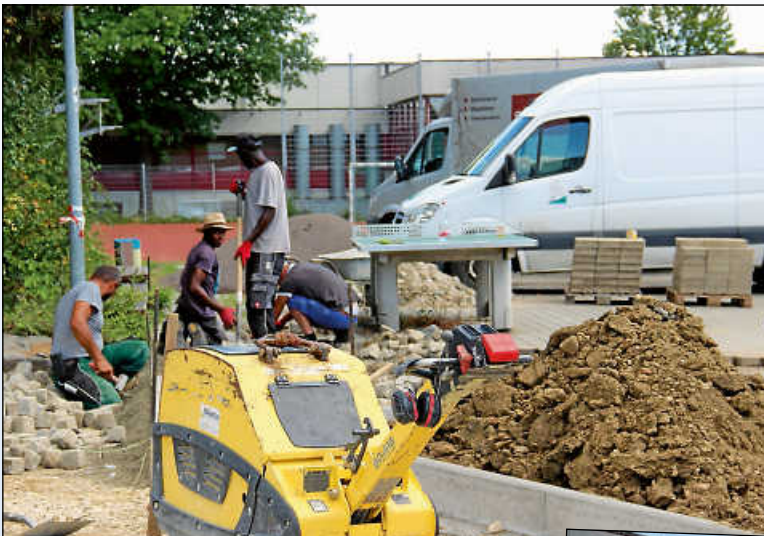
Landschaftsgärtner passen den Pausenhof an.

In den Sommerferien werden die letzten Arbeiten erledigt: