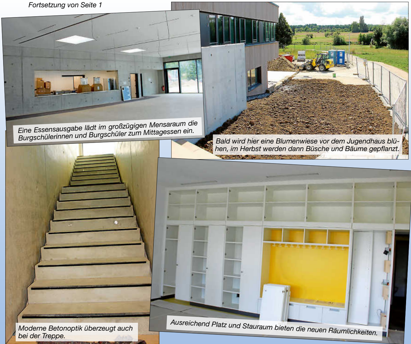
Eine Essensausgabe lädt im großzügigen Mensaraum die Burschülerinnen und Burschüler zum Mittagessen ein.