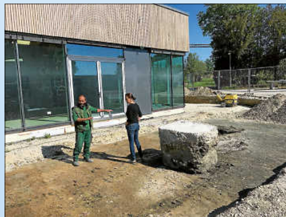
Gärtner und Planer der Außenanlagen