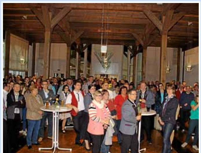
Großes Interesse zeigte die Bevölkerung bei der öffentlichen Bekanntgabe des Wahlergebnisses.